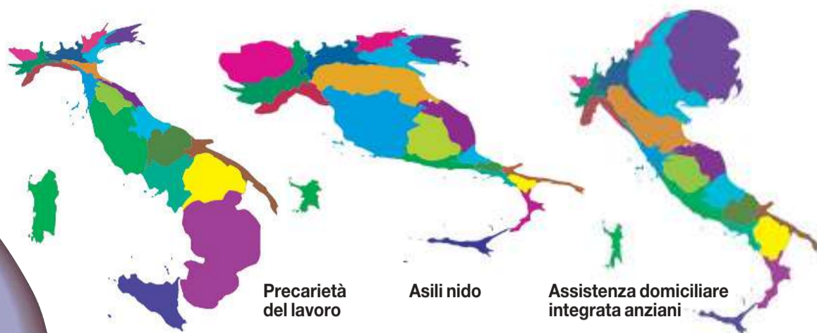
Precarietà del lavoro